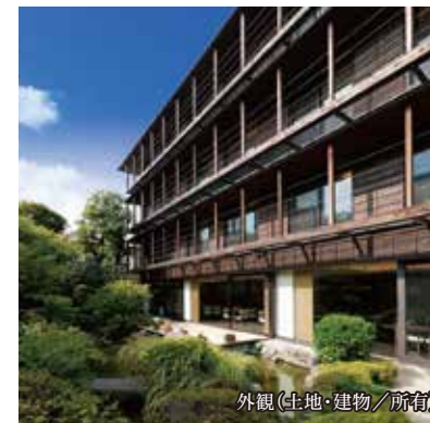
外観(土地・建物/所前)