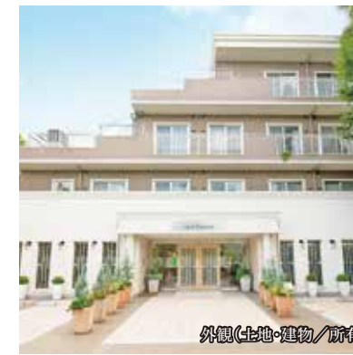
外観(土地・建物/廊下)