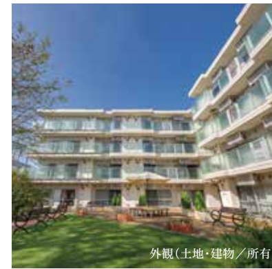
外観(土地・建物/所有)