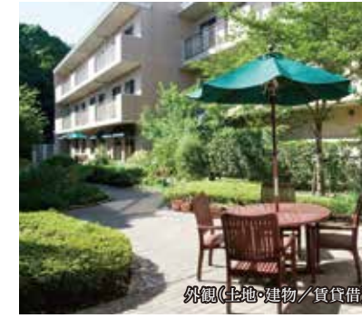
外観(土地・建物賃貸借)