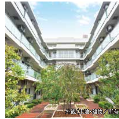
外観(土地・建物/所有)