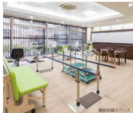
機能訓練スペース